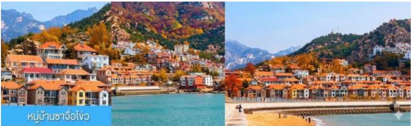
หมู่บ้านซาจื่อโ้ว

พักที่ WEIHAI BOYUE HOTEL / WEIHAI JIANGUO PUYIN โรงแรมระดับ 4 ดาวท้องถิ่นเมืองเวย์ไห่