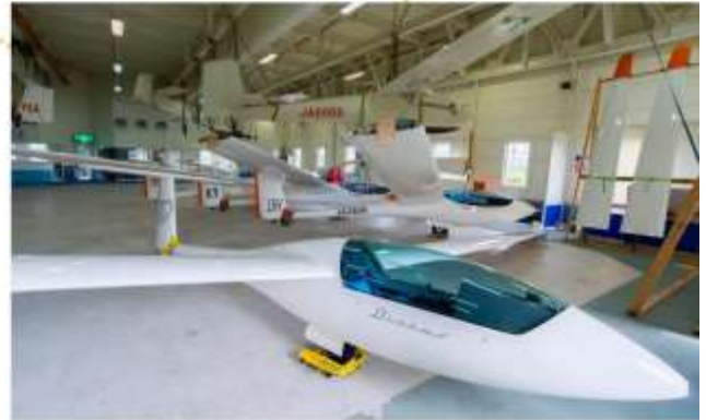
รับประทานอาหารกลางวัน ณ พิพิธภัณฑ์