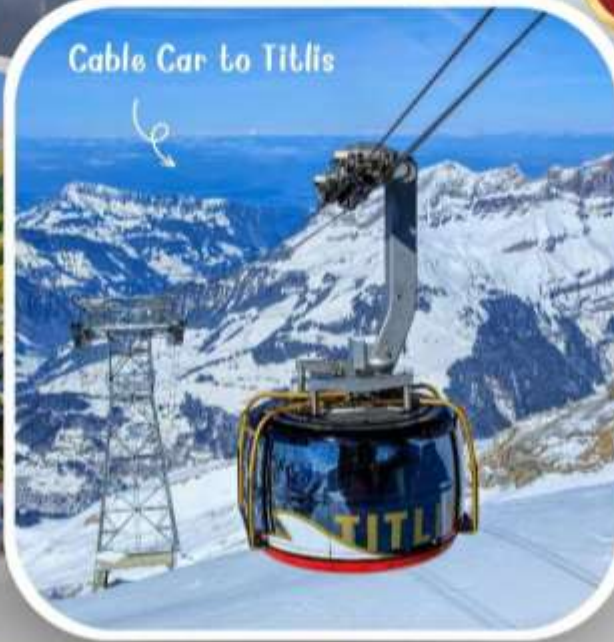
Cable Car to Titlis