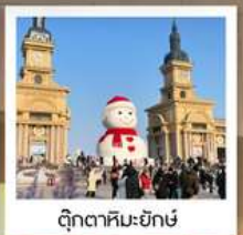
ตึกตาคีเย-ยักซ์