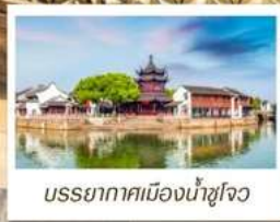
บรรยากาศเมืองน้ำซูโจว