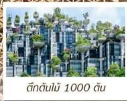
ตึกต้นไม้ 1000 ต้น