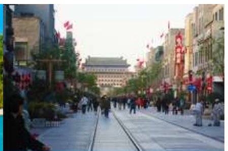
ถนนเวียนเหมิน