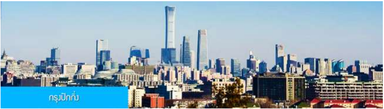
กรุงปักกิ่ง