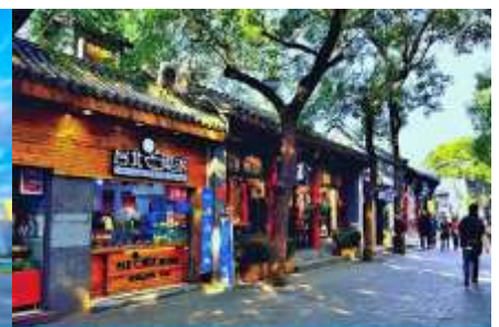
ชอยหนานหลิวกู่ชื่อย