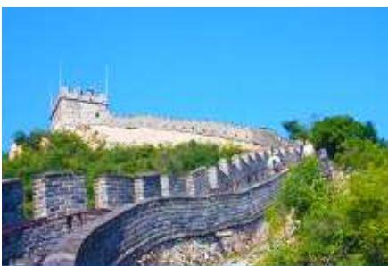
กำแพงเมืองจีนด่านหวงหวาน

พักที่ JINGLIN HTL OR HOLIDAY INN EXPRESS HTL 4* หรือ โรงแรมในระดับเดียวกันในกรุงปักกิ่ง