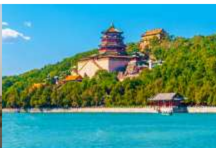
พระราชวังฤดูร้อนหยี่เหอหยวน