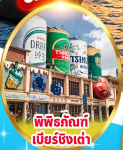
พิพิธภัณฑ์ เบียร์ซิงเต่า