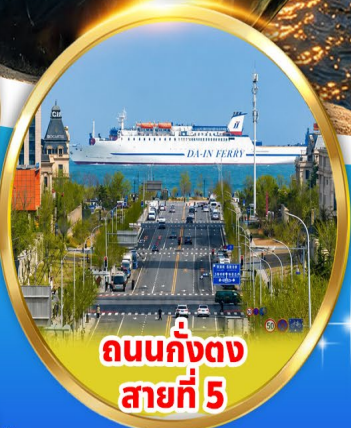
ถนนกึ่งตง สายที่ 5