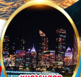
ชมการแสดง แสงสี ณ ชายหาด NO.3