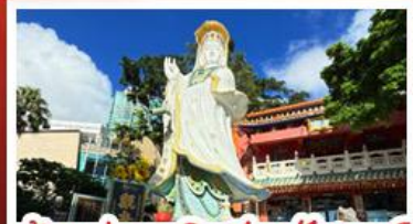
เจ้าแม่กวนอิมรัฟัสเบย์