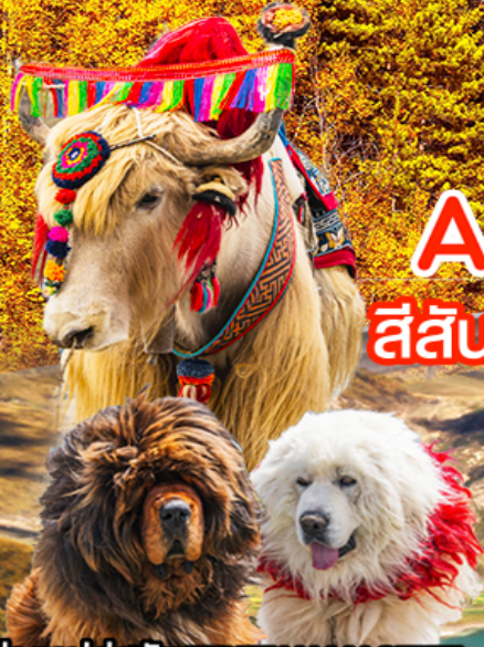
ถ่ายรูปคู่สุนัข TIBETAN MASTIFF จามรี และแพะ ทะเลสาบยิมดรก

สีสันแห่งฤดู บนดินแดนแห่งศรัทธา หลินจื่อ • ลานา