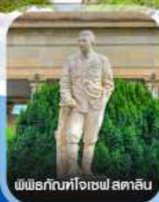
พิพิธภัณฑ์โจเซฟ สตาลิน