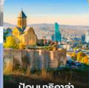
ป้อมนาริ کالا