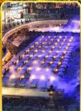
ชมยูบาทาเกะ