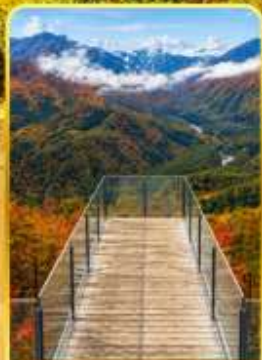
ฮาคูบะอิวาตาทะ