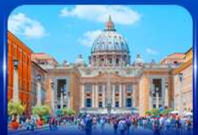
นครรัฐวาติกัน โรม