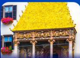
หลังคาทองคำ อินส์บรุค