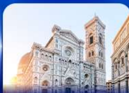
ชมเมืองแห่งศิลปะ ฟลอเรนซ์