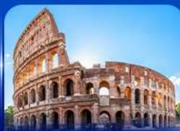
เข็ควินดัง โคลอสเซียม โรม