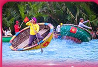
ล่องเรือกระดัง หมู่บ้านกิมทาน