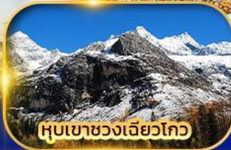
หุบเขาขวงเฉียวโกว