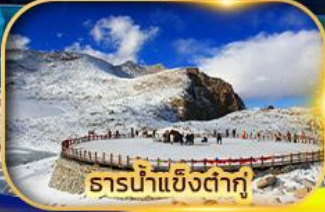
ธารน้ำแข็งต่ากู่