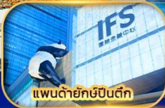
แพนด้ายักษ์ปิงตึก