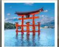
ศาลเจ้าอิตสึคุชิมะ