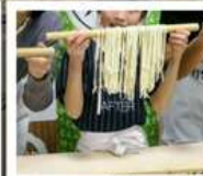
กิจกรรมทำเส้นอุด้ง