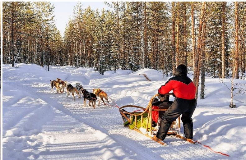
DOG SLEDDING ADVENTURE