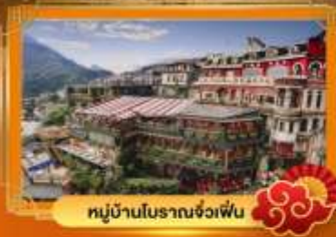
หมู่บ้านโบราณจ่งเฟิน