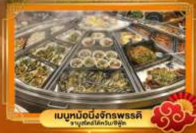
เมนูหม้อนึ่งจักรพรรดิ