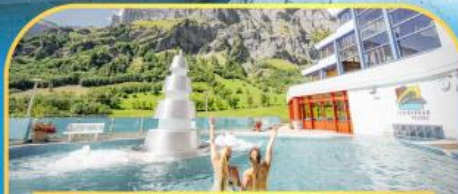
แช่น้ำแร่ร้อนผ่อนคลายลวยคอร์บิค