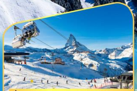
นั่งกระเช้าชมแมทเทอร์ฮอร์น