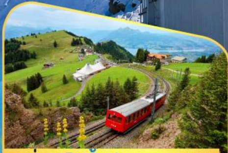
นั่งรถไฟขึ้นสู่ยอดเขาโรติก