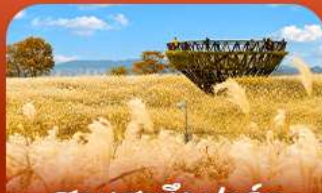
สวนฮานิลปาร์ก