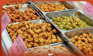
ตลาดมัจจอน