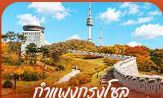
ทำแพนกรงโซล แบบบอมบ์แควร์

ออกเดินทางสู่ร่องราวแห่งฤดูใบไม้เปลี่ยนสี สัมผัสความงดงามของเกาะนามิและอุทยานแห่งชาติชอรัคซาน เพลิดเพลินกับความสนุกเต็มอิ่มที่สวนสนุกเอเวอร์แลนด์ • เก็บภาพความประทับใจท่ามกลางทุ่งหญ้าสีทอง และโบสถ์หลากสีที่สวนฮานิลปาร์ก • พร้อมชมวิวหอคอยนิมซานจากแบบคอนสแควร์ • เต็มเต็มความสุข ด้วยการลิ้มลองสตรีทฟู้ดสไตล์ที่ตลาดบึงวอน • ก่อนเพลิดเพลินกับการช้อปปิ้งในกรุงโซลตลอดทริป