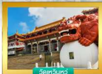
วัดเทวินหวั่น