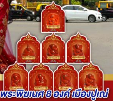
พระพึชเนศ 8 องค์ เมืองปูเน่